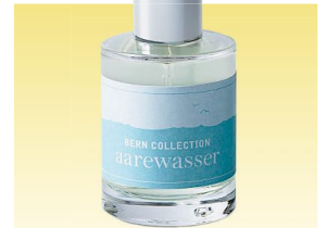
Parfum «Aarewasser», 69 Fr., von Art of Scent; artofscents.ch