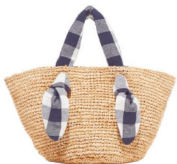
Grosse Handtasche, Jute, Fr. 39,95, von Mango, bei Manor; manor.ch

Dank Canvas-Henkeln mit Vichy-Karo holt man sich mit dieser Korbtasche ein Stück Provence an den Arbeitsplatz.