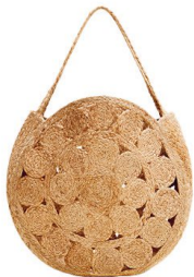
Schultertasche, 243 Fr., von Clare V, über 24s.com

Aktenordner lassen sich am schönsten hinter den geflochtenen Rondellen dieser Carry-all-Tasche verstauen und herumschleppen.